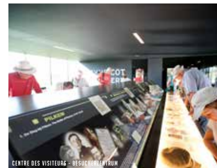
CENTRE DES VISITEURS - BESUCHERZENTRUM

Le « Tyne Cot Cemetery », havre de paix impressionnant, mais modeste, s'étend dans cet ancien paysage de guerre. Ses 11 956 tombes font de lui le plus grand cimetière du Commonwealth au monde, témoin silencieux de la sanglante Bataille de Passchendaele. Près de 500 000 victimes perdirent ici la vie en moins de 100 jours durant l'offensive britannique de 1917 pour ne finalement gagner que huit kilomètres de terrain.