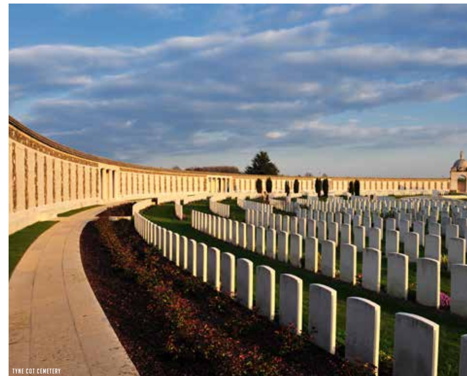
TYNE COT CEMETERY

ENTRÉE LIBRE / FREIER EINTRITT PÉRIODE DE FERMETURE : DU 1ER DÉCEMBRE AU 31 JANVIER INCLUS (CENTRE D'INFORMATIONS) GESCHLOSSEN VOM 1. DEZEMBER BIS EINSCHL. 31. JANUAR (BESUCHERZENTRUM)